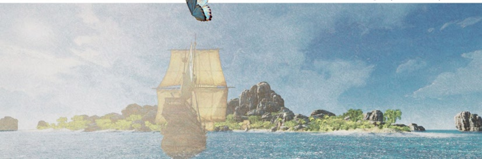
Image du spectacle - le bateau pirate

paro de seil paro de léille la bestia paran le tsa