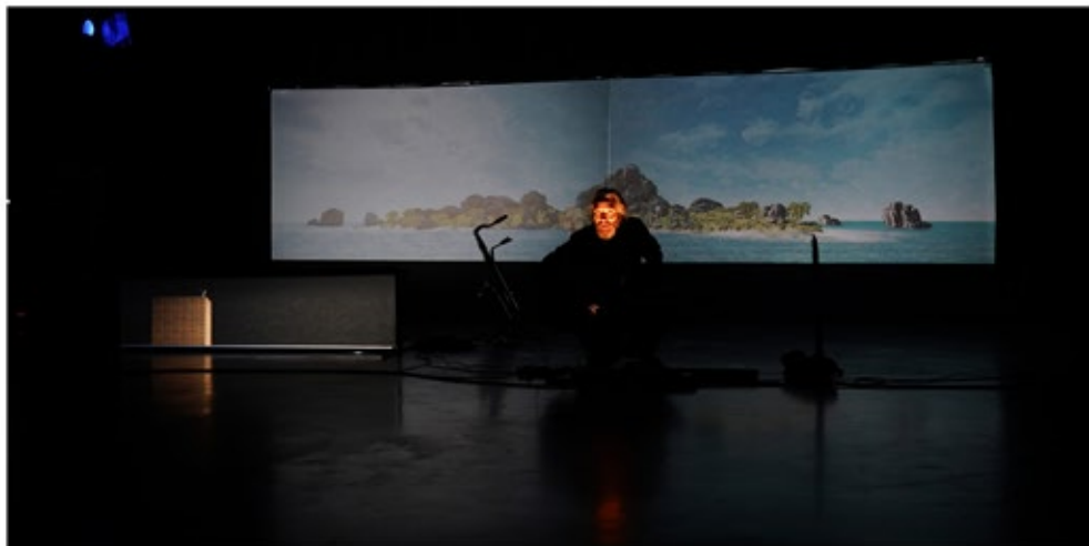
Image du spectacle - le bateau pirate