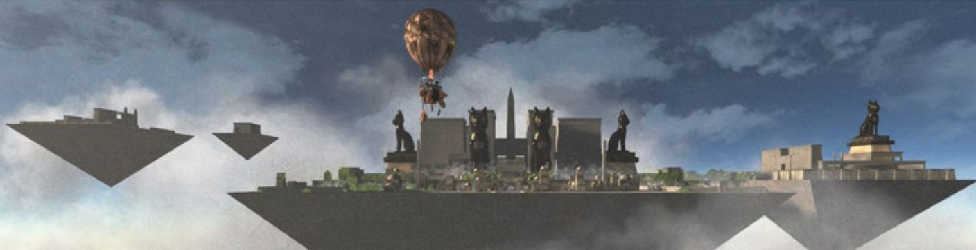
Image du spectacle - La ville dans le ciel

40 rue de la république 63200 Saint-Bonnet-Près-Riom N° Siret : 423 231 687 000 41 / APE : 9001Z / Licence spectacle : 2-1010771 / 3-1010772 lartpourtous@gmail.co