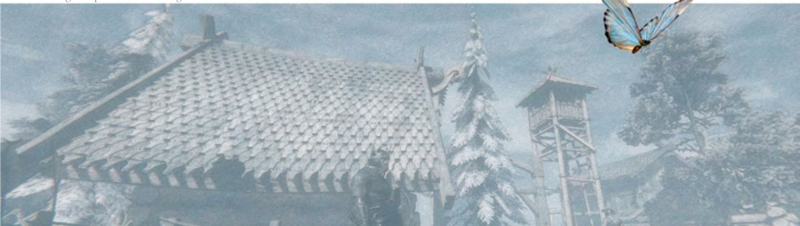
Image du spectacle - Terres du grand Nord

Mais aussi sur «da boucle», l'enregistrement live ect...