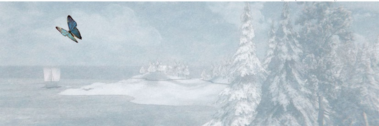
Image du spectacle - Terres du grand nord